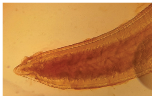
Рис. 5. Хвостовой конец самки Pseudoterranova decipiens (10 × 4) от моржа