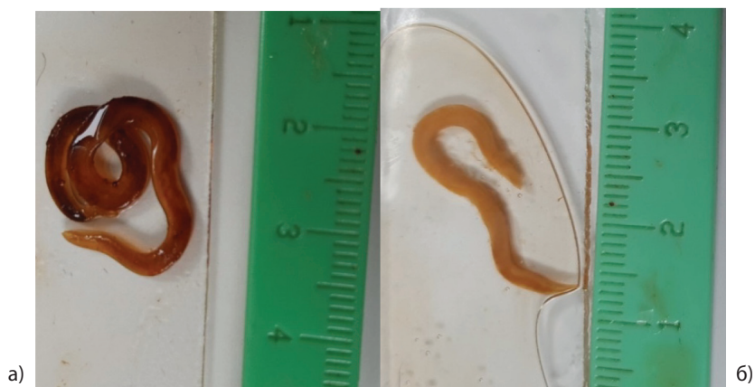
Рис. 3. Половозрелые самки Pseudoterranova decipiens от моржа (а) и ларги (б) [Fig. 3. Mature females of Pseudoterranova decipiens from walrus (a) and spotted seal (b)]