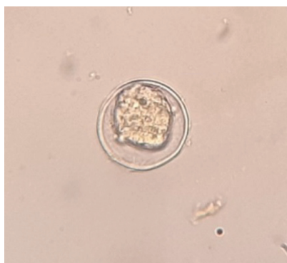
Рис. 4. Яйцо Pseudoterranova decipiens из матки самки (10 × 10) от ларги