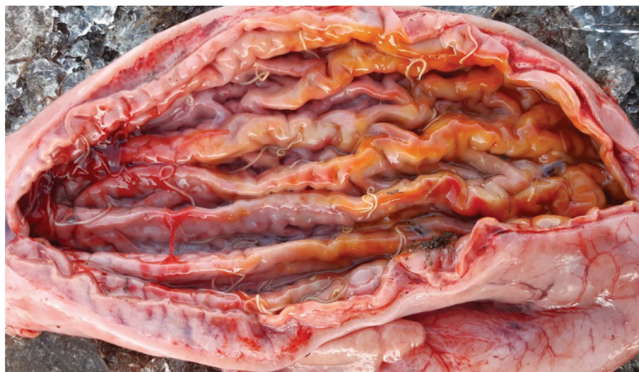
Рис. 2. Анизакиды в желудке ларги [Fig. 2. Anisakis spp. in the stomach of a spotted seal]

Нематод находили как у взрослых особей с хорошей упитанностью – моржа в возрасте старше 15 лет (толщина жира 5 см), ларги (5,5 см), кольчатой нерпы (3,5 см), так и у молодых особей ларги и кольчатой нерпы с толщиной жира 1,5–2,5 см. Наиболее высокую интенсивность инвазии наблюдали у молодой кольчатой нерпы, имеющей рваные раны на спине и толщину жира 1,5 см.