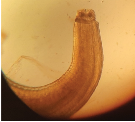
Рис. 7. Головной конец Pseudoterranova decipiens (10 × 4)

[Fig. 7. Head end of Pseudoterranova decipiens (10 × 4)]