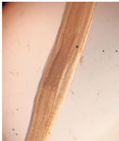
Рис. 11. Область ventriculum личинки Anisakis simplex (10 × 4) от ларги

[Fig. 10. The head end of the Anisakis simplex larva (10 × 10) from the spotted seal]