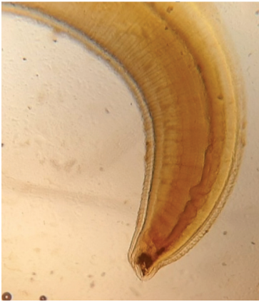
Рис. 9. Хвостовой конец личинки Anisakis simplex с мукроном (хвостовой шип) (10 × 10) от ларги

[Fig. 8. Morphology of Pseudoterranova decipiens : intestinal coecum (10 × 4)]