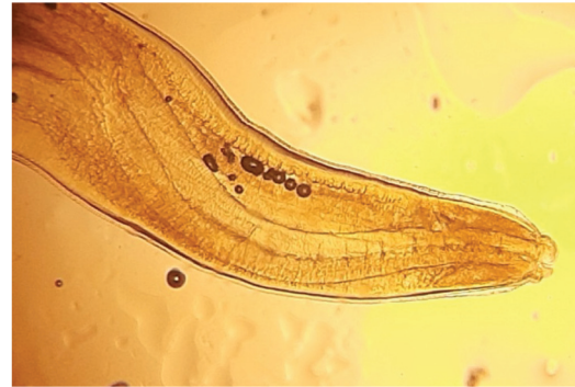
Рис. 10. Головной конец личинки Anisakis simplex (10 × 10) от ларги

[Fig. 9. Tail end of Anisakis simplex larva with mucron (tail spine) (10 × 10) from the spotted seal]