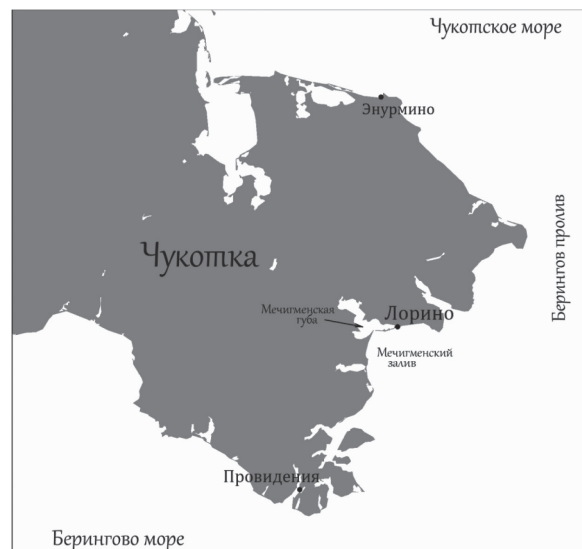
Рис. 1. Географическое положение исследованного региона

13 кольчатых нерп (8 молодых и 5 взрослых особей). Животные в большинстве имели хорошую упитанность (слой подкожного жира в среднем 3,2 см). Обнаруженных гельминтов фиксировали в 70%-ном спирте. Видовую принадлежность гельминтов определяли на кафедре паразитологии и ВСЭ МВА им. К. И. Скрябина с использованием справочной литературы.